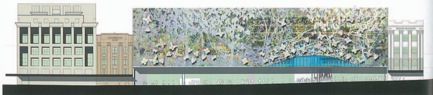
Pohled na čelní fasádu